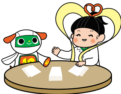
ニッポンデータ公式キャラクター データ君 (左) とニッポ姫 (右)